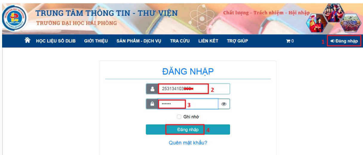
Hình 2: Giao diện đăng nhập tài khoản

Sau khi đăng nhập thành công, bạn đọc kiểm tra thông tin tài khoản như Hình 3 .