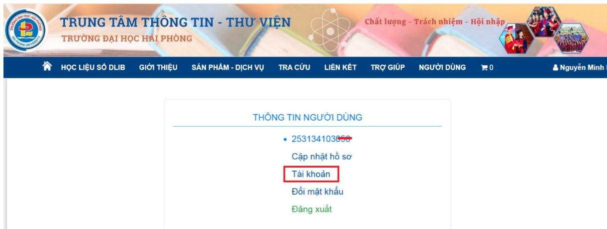
Hình 3: Giao diện sau khi đăng nhập thành công

Bạn đọc kiểm tra các thông tin giao dịch trên hồ sơ bạn đọc như Hình 4 .